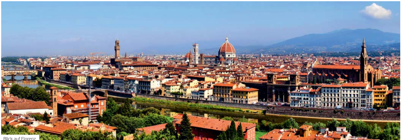
Blick auf Florenz