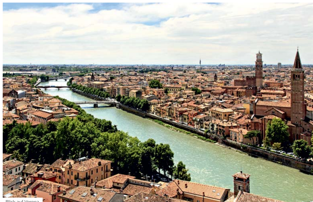
Blick auf Verona

Grundprogramm und Ausflugspaket je 30 Personen, Zusatzausflug 25 Personen (muss seitens des Veranstalters bis 28 Tage vor Reisebeginn erreicht werden). Gesamtmindestteilnehmerzahl für den DERTOUR-Sonderflug 100 Personen.